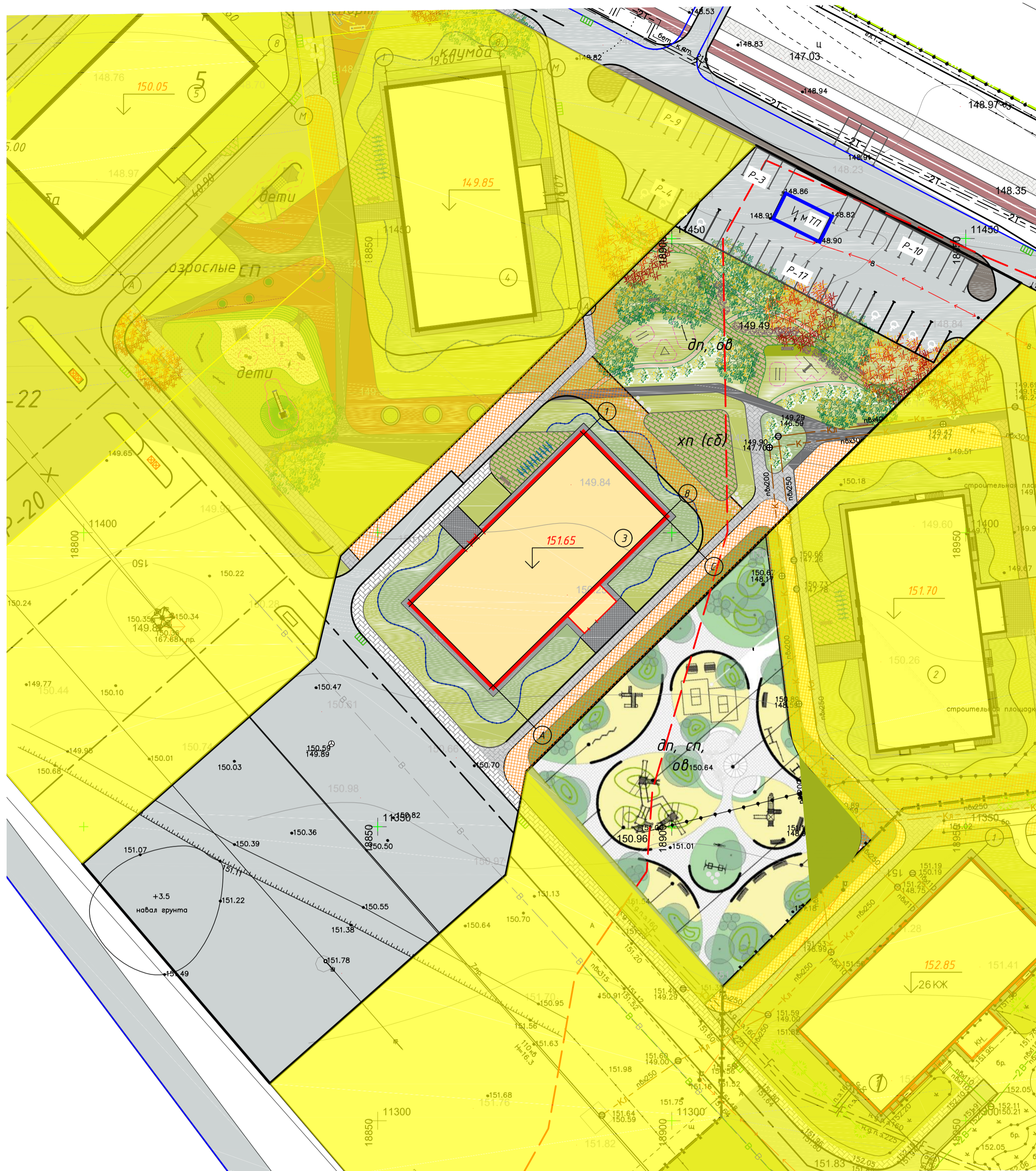
Ведомость жилых и общественных зданий и сооружений